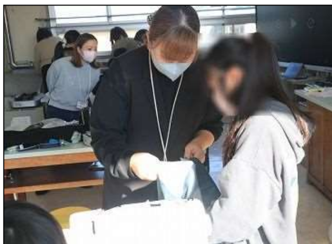
↑鈴川小サポーターのご協力例（5年：家庭科）

多数の貴重な情報やご意見を頂戴しました。いじめ解消に向けた取り組み、また来年度（令和8年度）の教育活動の参考にさせていただきます。双方とも結果については、まとまりましたらお知らせいたしますので、今しばらくお待ちいただければ幸いです。